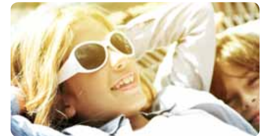
Eventuele druk- en zetfouten voorbehouden. De algemene voorwaarden zoals beschreven in deze brochure zijn geldig vanaf 1 januari 2013.

Kia Motors Nederland B.V. en de Kia-dealer of Kia-reparateur behouden zich het recht voor de voorwaarden van de door hen verleende K.I.W. tussentijds, zonder voorafkondiging, eenzijdig te wijzigen.